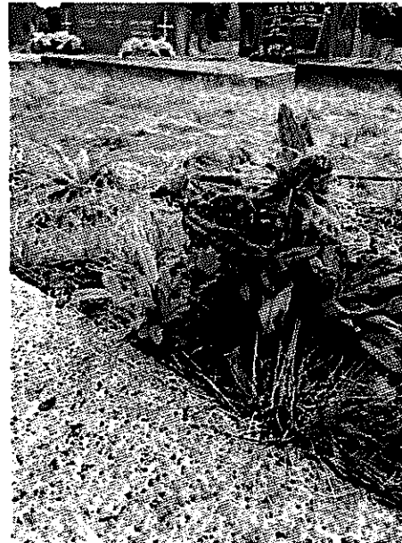
Kuvat ja : Vas. valkomaksaruoho ja oik. kyläneidonkieli (kortteli 3)