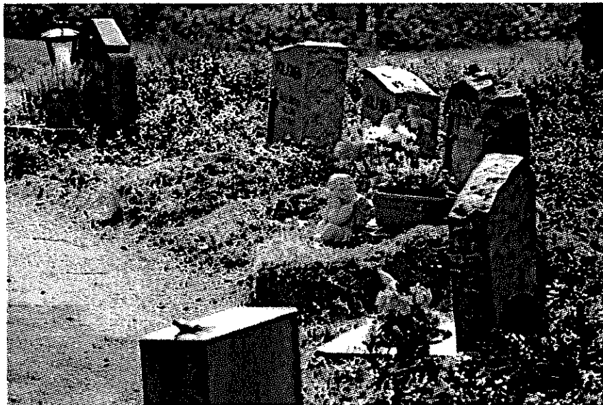
Kuva 5: Porin metsähautausmaata on rakennettu luonnon ehdoilla.

Luonnon monimuotoisuuden suojelemisesta puhutaan nykyisin paljon, ja erilaisia niitty- ja ketoalueita sekä hyönteisten pesäpaikkoja on perustettu monien kaupunkien puistoihin. Vastikään niitä on alettu perustaa myös hautausmaille (kts. esim. Kellonummen hautausmaa Espoossa, sekä palkittu