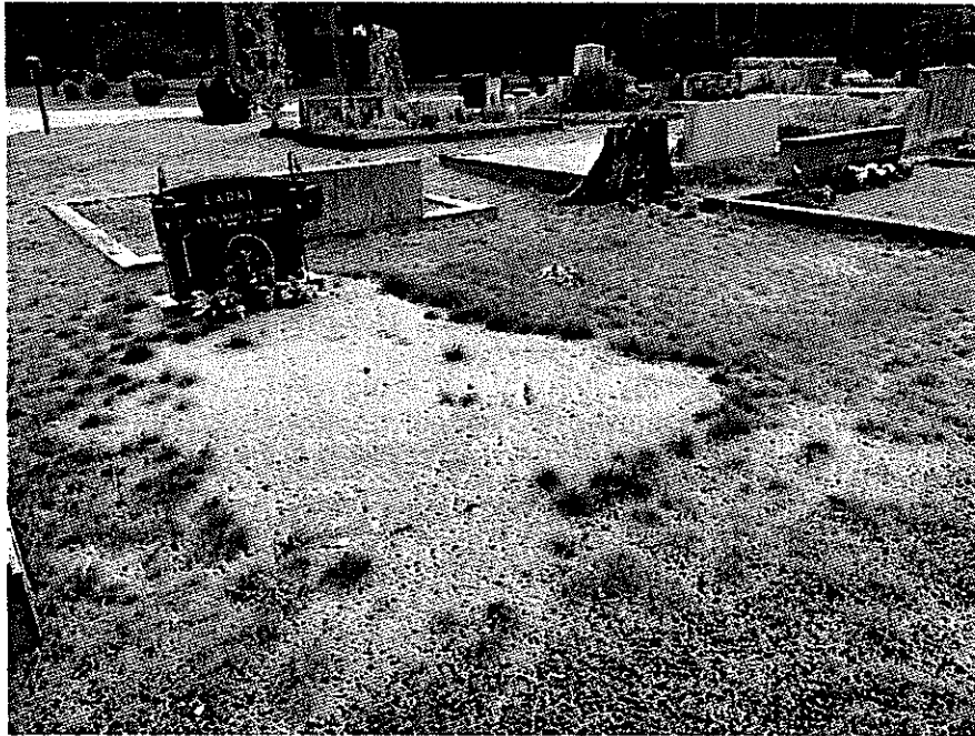
Kuva 2: Tämän haudan pinta on hiekkaa ja ruohotuppaita